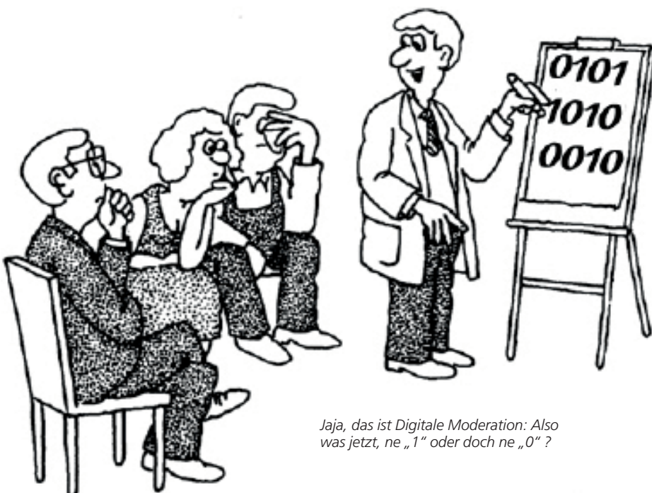
Jaja, das ist Digitale Moderation: Also was jetzt, ne „1“ oder doch ne „0“ ?

Auf den ersten Blick wird lediglich die Pinnwand durch den Monitor ersetzt, doch bei genauerem Hinsehen werden die Details dieser Innovation deutlich. Im Folgenden - in knapper Form - die Haupt-Vorteile der SixSteps ® DigitalModeration: